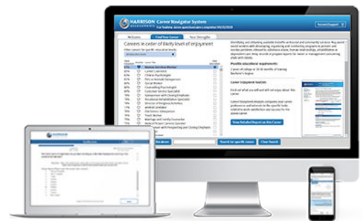
Portal Karier Interaktif Online